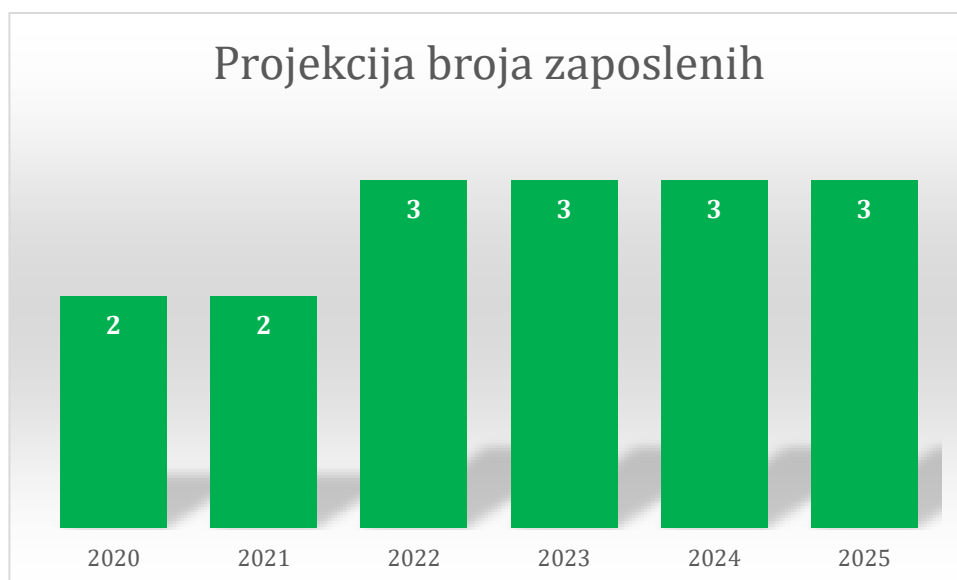
Grafički prikaz: Plan kretanja broja zaposlenih po godinama